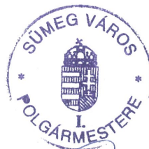
VÉGH LÁSZLÓ POLGÁRMESTER